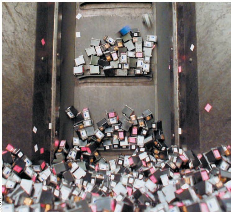
Die gebrauchten, leeren Kartuschen kann der Hersteller oder ein Drittanbieter recyklieren