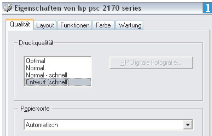
Im Druckmenü – hier am Beispiel von HP – haben Sie die Möglichkeit, die Druckqualität einzustellen