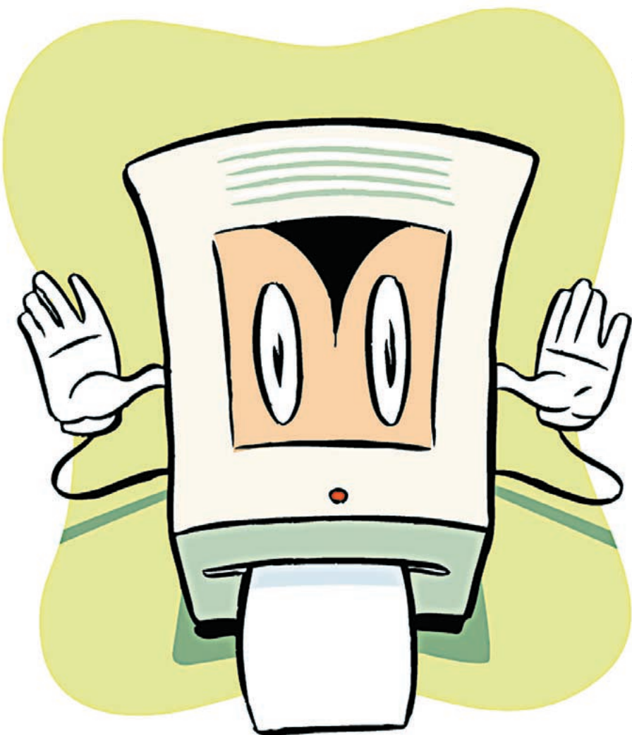
ILLUSTRATION MARK MATCHO

■ Eine weitere Alternative bietet sich Ihnen, wenn Sie immer dieselbe Seite ausdrucken, etwa einen Brief, der an alle Mitglieder eines Vereins geht: Sie lassen sich die Seite in einem Fachgeschäft kopieren. Das nächste Preisbeispiel beruht auf den