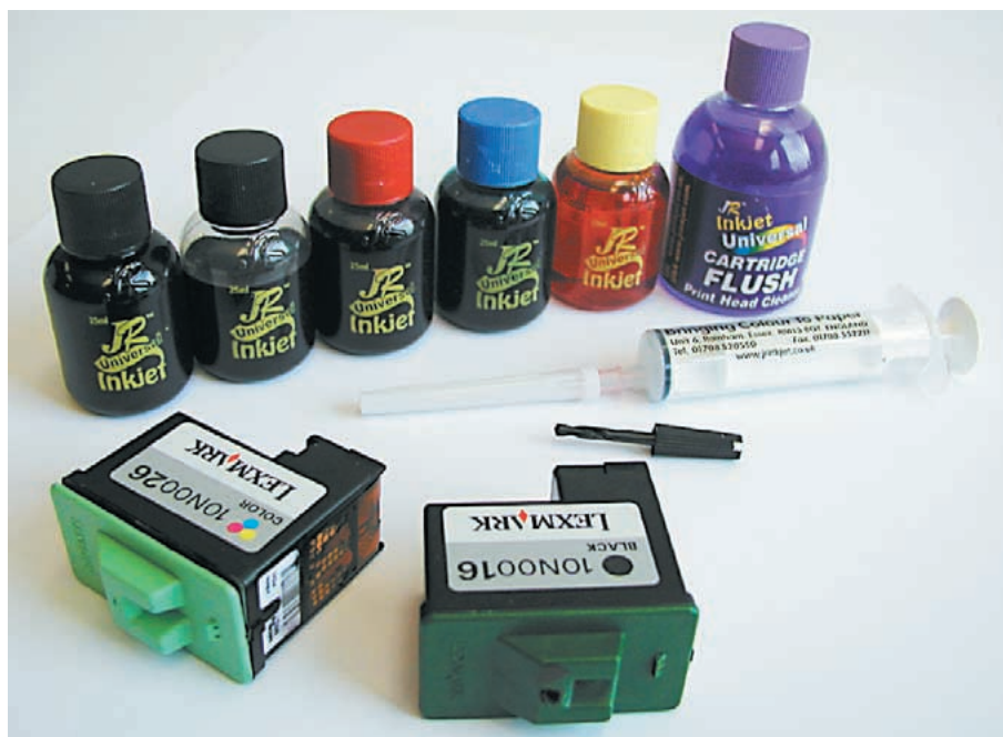
Nur für Bastler geeignet: Tintenpatronen selbst nachfüllen

Selbst nachfüllen: Sind Sie ein Bastlertyp und scheuen sich nicht vor farbigen Fingern, können Sie gebrauchte Patronen und Kartuschen selbst wieder auffüllen. Für Tintendrucker gibts die verschiedensten Lösungen: die aufwändigeren mit verschiedenen Flaschen und einer Spritze zum Einfüllen der Tinte, die einfacheren mit Nachfüllsets, die auf die Patrone gesetzt werden und die leeren Tanks in einem Arbeitsgang füllen. Diese Nachfüllsets bringen eine Kosteneinsparung von bis zu 90 Prozent. Für 99 Franken erhalten Sie im Fachhandel zum Beispiel Sets der Firma JR Inkjet, ▶