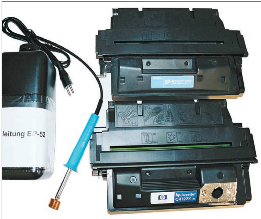
Ein Tonerset zum Nachfüllen

die je nach Patronentyp gut 10 Nachfüllungen pro Farbe erlauben. Das Füllen einer Patrone kostet also nur etwa Fr. 2.50.